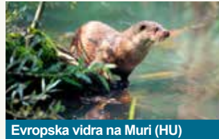
Evropska vidra na Muri (HU)