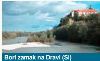
Borl zamak na Dravi (SI)