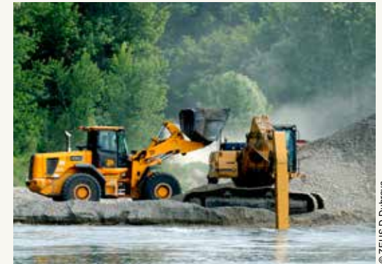
Kanalisanje reka uništava žive reke

Trenutno, oblasti koje su najviše pogođene planiranim kanalisanjem velikih razmera su prirodni pojasevi oko Dunava i Drave u graničnom području između Hrvatske, Mađarske i Srbije, što će imati uticaj na centralno područje rezervata biosfere kao što je Park prirode „Kopački Rit“.