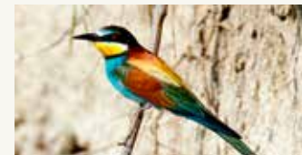
Pčelarica na Dravi (HU)