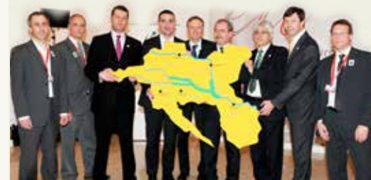
Mart 2011: nadležni ministri svih pet zemalja obuhvaćenih PRB MDD prilikom potpisivanja zajedničke deklaracije.