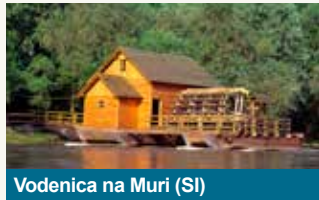
Vodenica na Muri (SI)