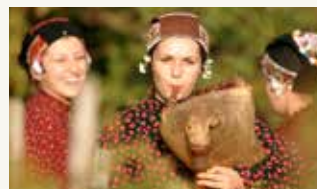
Bodrog festival u Bačkom Monoštoru (RS)