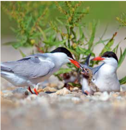
Bregunicama je potrebna strma obala kako bi uzgajale svoje mladunce