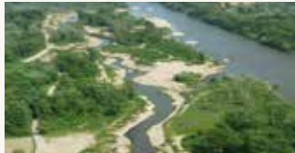
Revitalizacija Mure (AT)