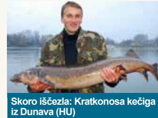
Skoro iščezla: Kratkonosa kečiga iz Dunava (HU)