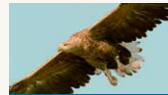
Orao belorepan u Kopačkom Ritu (HR)