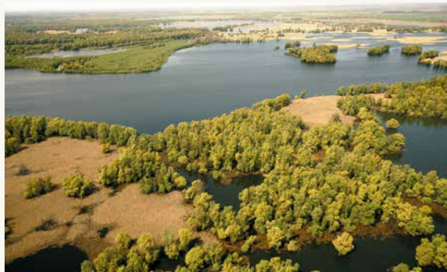
Park prirode „Kopački Rit“: Ušće Drave u Dunav smešteno je u središtu Rezervata biosfere

Uprkos brojnim promenama nastalim dejstvom čoveka u prošlosti, ovaj zadivljujući rečni predeo područje je izuzetne biološke raznovrsnosti i centar retkih prirodnih staništa kao što su velike plavne šume, rečne ade, šljunkovite i peščane obale, rečni rukavci i mrtvaje. Ova staništa su dom najgušćoj populaciji gnezdećih parova orla belorepana u centralnoj Evropi i drugih ugroženih vrsta kao što su mala čigra, crna roda, dabar, vidra i skoro iščezla kratkonosa kečiga. Svake godine, više od 250,000 migrirajućih ptica močvarica koristi reke za odmor i ishranu.